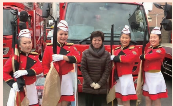
仙台市消防出初式(1月)