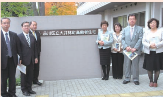
東京都品川区・サービス付き高齢者向け 住宅を訪問(12月)