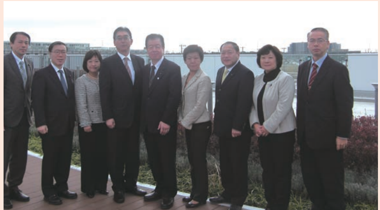
地下鉄東西線が開通。 着々と整備が進んでいる荒井駅前にて(12月)