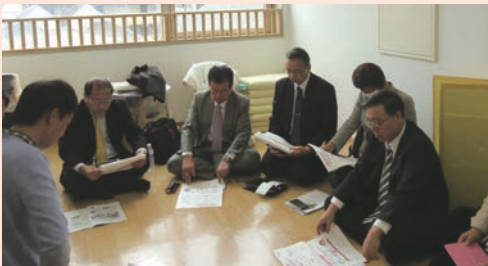
障がい児保育園「ヘレン」を視察(12月)