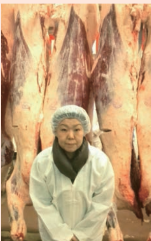
仙台市卸売市場 業務開始式、初せりに 参加(1月)