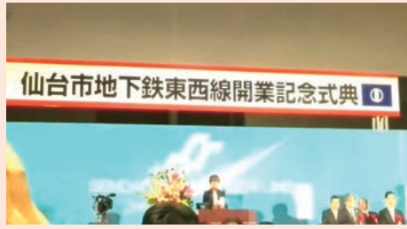
地下鉄東西線開業 記念式典に参加(12月)