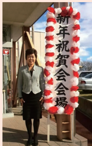
地域の新年祝賀会に 出席(1月)