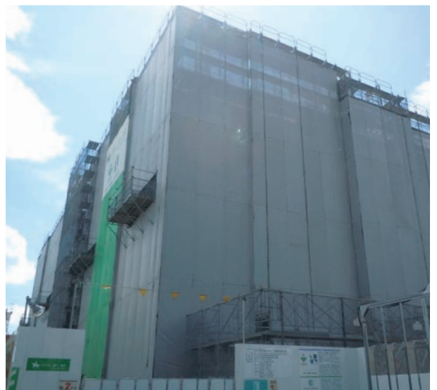
建設中の幸町高層整備(幸町)