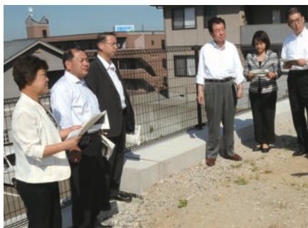
宅地復旧工事現場を視察

避難所等への防災対応型太陽光発電の導入の一貫として拡張型システム構成を取り入れている宮城総合支所を視察。購入電力量を削減し、災害時の電源確保にも備えます。また、仙台市が施行する宅地復旧工事第1号となった泉区松森字明神地区へも視察。5月20日に完了し現在は住宅の建設にも着手しております。