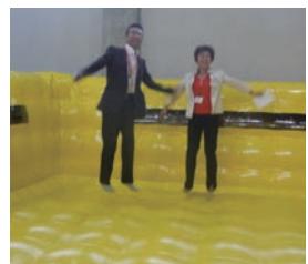
ぴよんぴよんドームを視察