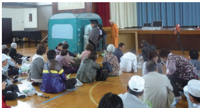
女性の着替えや授乳スペースとして活用できるBOX

35年前の1978年(昭和53年)6月12日、宮城県沖でM7.4の地震が発生。震災後2回目となる市民防災の日、岡田小学校にて生徒と地域の方々と一緒に総合防災訓練に参加しました。校舎3階への避難訓練後、体育館では備蓄の確認をし、女性の着替えや授乳スペースとして活用できるBOXを確認。2畳ほどのスペースですが、女性にとっては大変有りがたいBOXです。