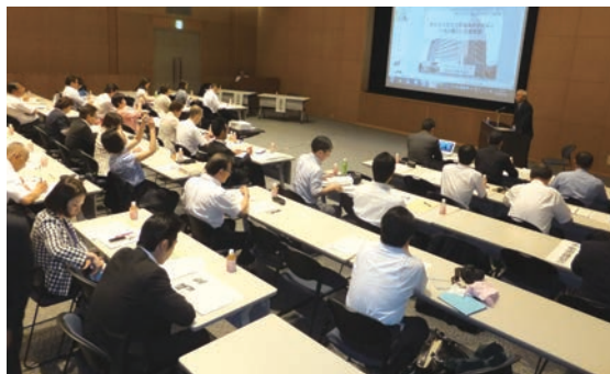
第2回 東北新市議会議員研究会の様様