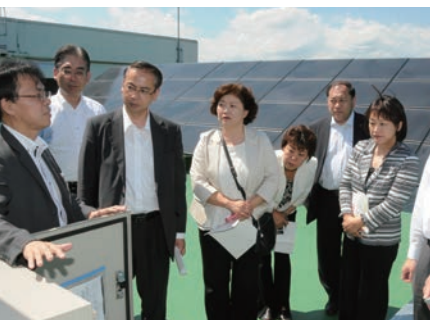
太陽光パネルを視察