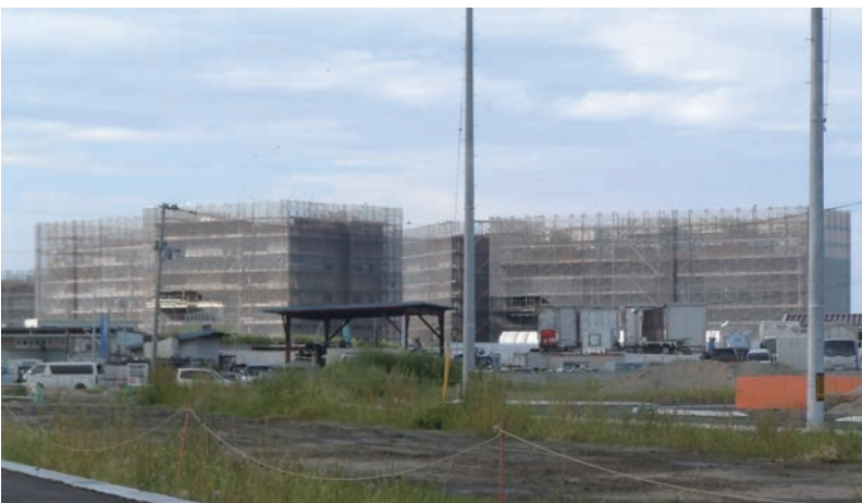
建設中の復興公営住宅(田子西)

心の不調は、体の不調と比べて自覚しにくいことから、本市では精神保健福祉総合センターのホームページや心のケアのパンフレットにおいて、市民の方が心の健康状態を確認できるチェックシートを掲げています。今後「こころの体温計」の導入の可能性を検討してまいりたいと考えております。