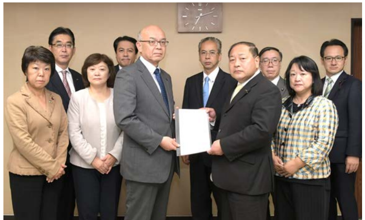
台風19号被害対応に関する緊急要望書を仙台市に提出

早急な被災状況の把握、り災証明書の速やかな発行、決壊した河川の改修と言った対策と仙台市の強靱化などを仙台市へ強く求めました。