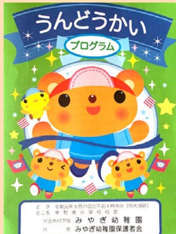
幼稚園の運動会に参加