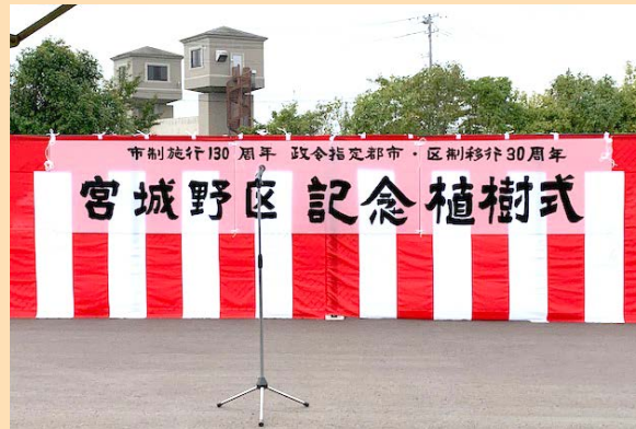
宮城野区記念植樹式