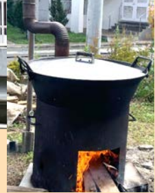
鶴ヶ谷地域の芋煮会に参加