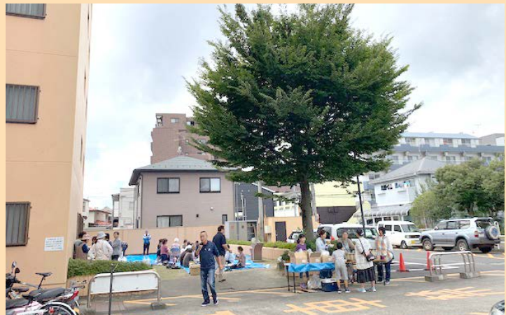
幸町地域の芋煮会に参加