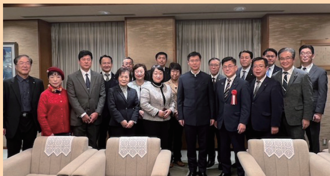
「仙台春節祭」に参加させて頂きました。素晴らしい出会いと演目、ありがとうございました(1月15日)