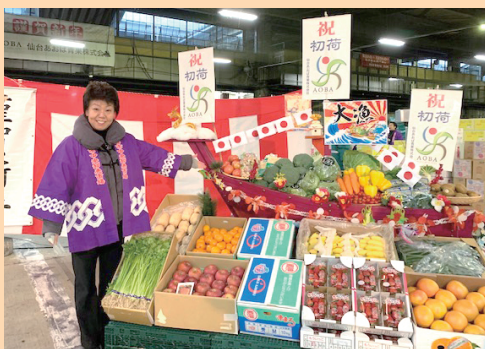
仙台の台所、中央卸売市場業務開始式に参加。早朝より、食の安心安全な供給に感謝です(1月5日)