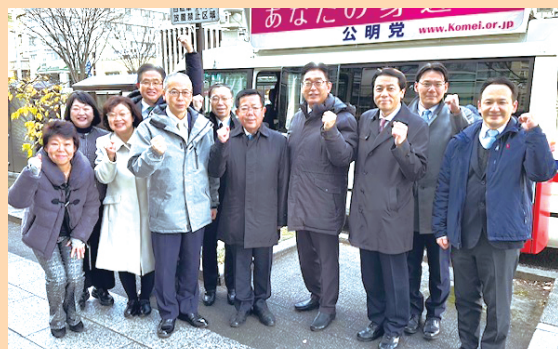
市内中心部で新春の街頭演説を開催(1月2日)