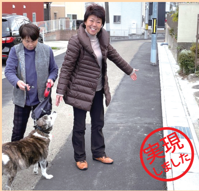
私道から市道に移行した道路の側溝整備を行いました。