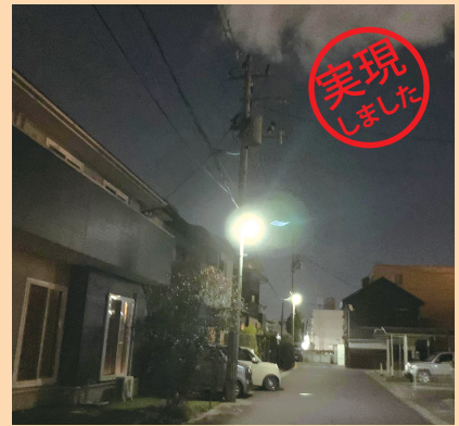
幸町の私道に街灯設置しました。