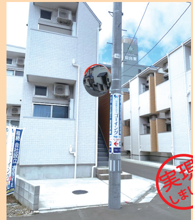
接触事故があった箇所にカーブミラー設置しました。[平成1丁目]