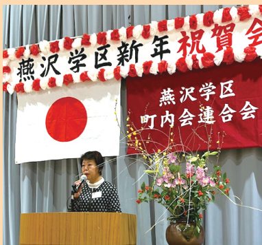
燕沢学区新年祝賀会(1月6日) 鶴ヶ谷地区新春賀詞交歓会(1月7日)に参加。