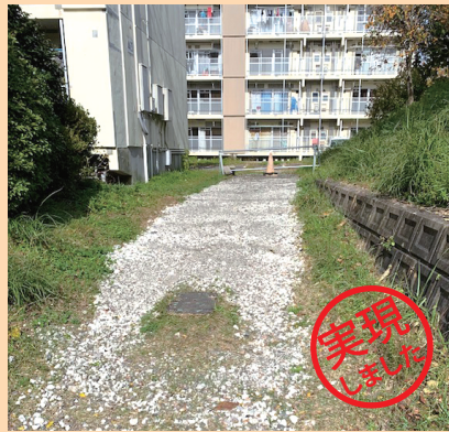
水捌げが悪い、鶴ヶ谷市営住宅間の通路の整備を行いました。