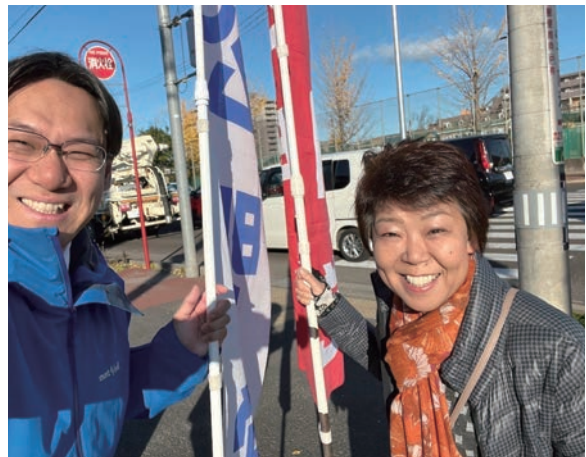
大池県議と朝のごあいさつ