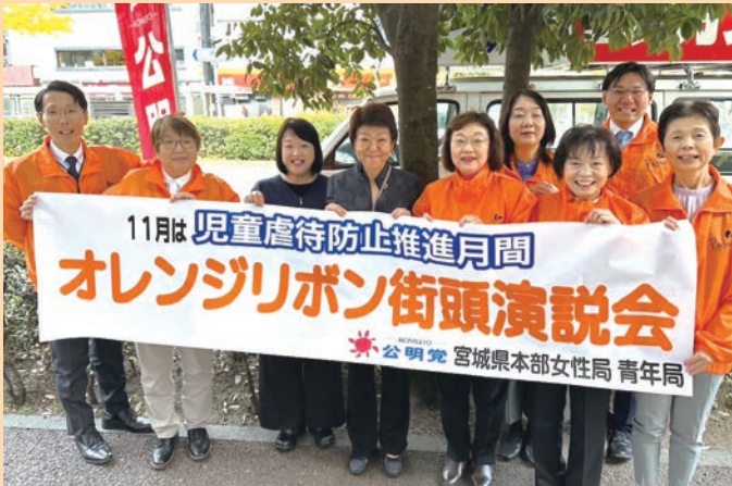
児童虐待防止推進月間「オレンジリボン街頭演説会」に参加(11月)