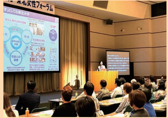
公明党東北女性フォーラムを開催(9月22日) 「あなたとつくるダイバーシティ」をテーマに基調講演もプレゼンテーションも大変に勉強になりました