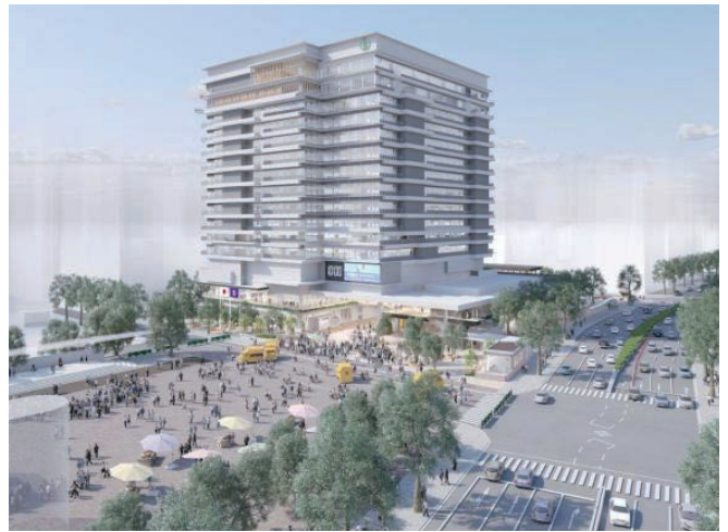
新仙台市役所本庁舎完成予想図