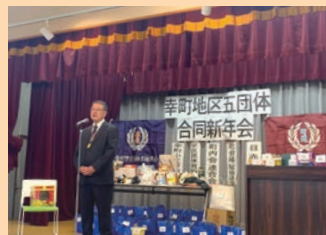
鶴ヶ谷と地元幸町の新年祝賀会に参加(1月19日)