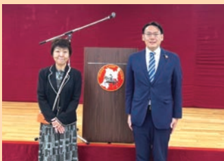
令和6年度 仙台駐屯地成人行事に大池康一県議と参加(1月15日)