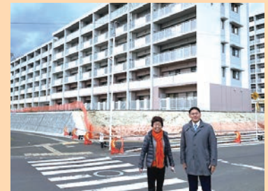
入居間近の鶴ヶ谷市営第二住宅(12月)