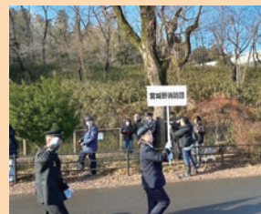
仙台市出初式に参加(1月7日)