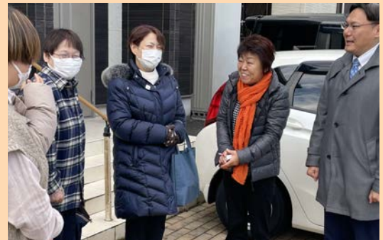
様々な場面で、ご挨拶させて頂きました。温かいご声援に感謝です。(12月)