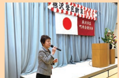
燕沢学区新年祝賀会に参加(1月12日)