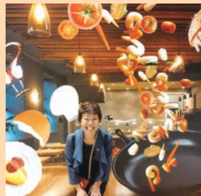
ごはんといのちのストーリー展へ(9月15日)