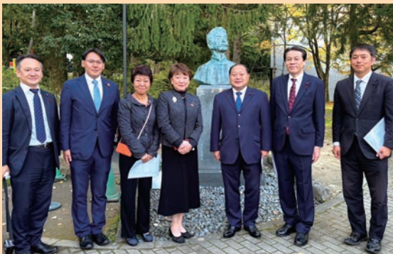
魯迅仙台留学120周年記念祭碑善献花式に参列(10月28日) 1904年秋から1906年春まで仙台に留まった、文豪魯迅。更に学び、歴史を深めてまいります。