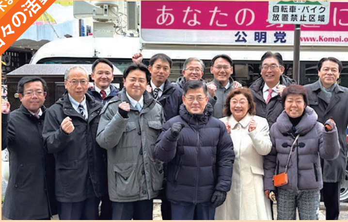
新春のごあいさつ(1月) 団結第一!今年もよろしくお祈りします。