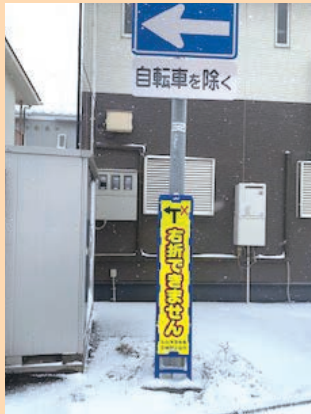
注意喚起の看板を設置 東仙台から新田へ抜ける踏切(案内踏切) 一方通行で左折のみですが時々右折する 車両があり時々危険でした。