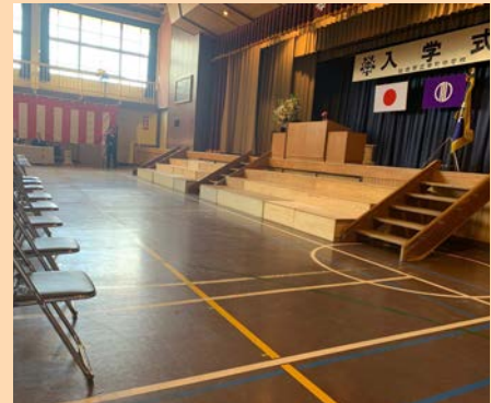
小中学校の入学式 地元、幸町小中学校の入学式に参加。 関係者と学校教育問題について意見交換を行う。